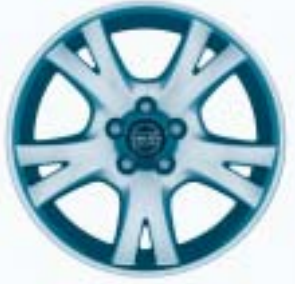
Orestes 7.5 x 17"