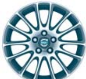
Tucana 7.5 x 17"