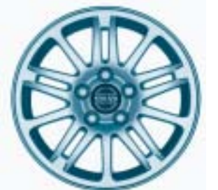
Musca 6.5 x 15"