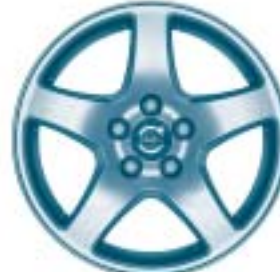
Nodus 7 x 16"