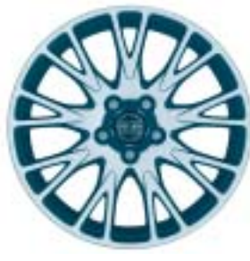
Orpheus 7.5 x 17"