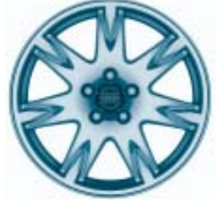
Thor 7.5 x 17"