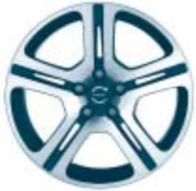
Cassiopeia 7.5 x 17"