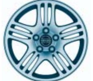
Eurus 7 x 16"