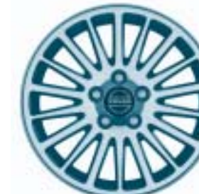
Electra 6.5 x 16"