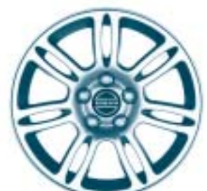
Echo 6.5 x 16"