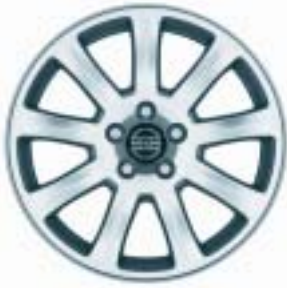
Interceptor 7 x17"