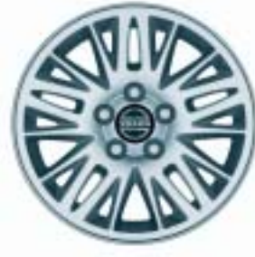
Saurus 6.5 x15"